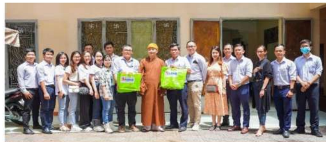
Ủng hộ nhu yếu phẩm cho các hộ gia đình hoàn cảnh khó khăn tại chùa Hưng Long, TP.HCM