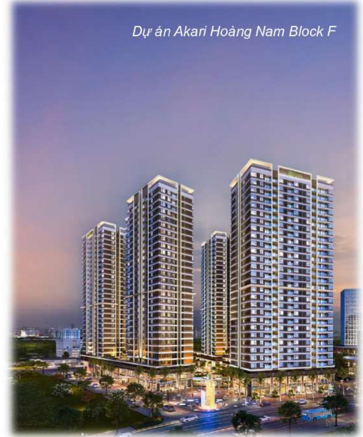
Dự án Akari Hoàng Nam Block F