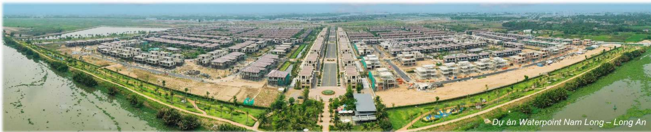
Dự án Waterpoint Nam Long – Long An