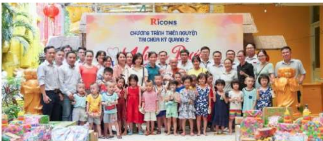
Tặng quà trẻ em mồ côi tại chùa Kỳ Quang, TP.HCM chương trình “Vững bước em tới trường”