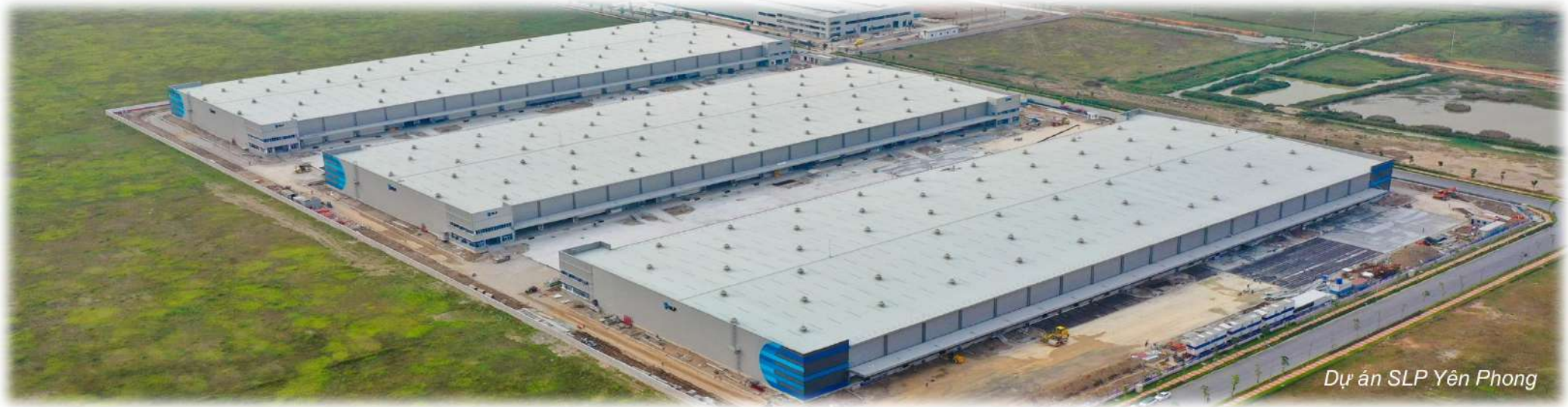
Dự án SLP Yên Phong