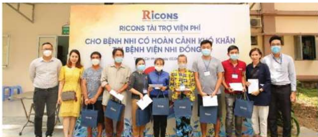
Tài trợ viện phí cho trẻ em mắc bệnh tim bẩm sinh có hoàn cảnh khó khăn