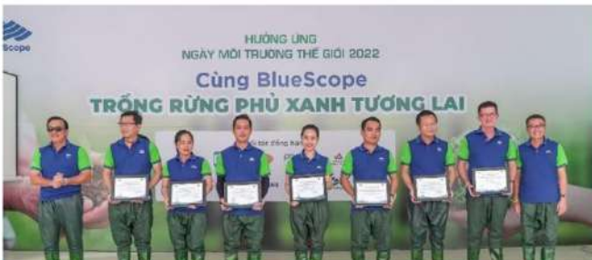
Tài trợ & tham gia chương trình “Trồng rừng phủ xanh tương lai” hưởng ứng ngày Môi trường thế giới