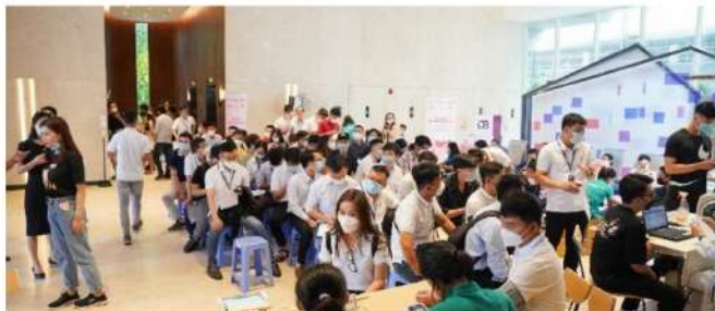
Hiện máu nhân đạo nhân ngày Truyền thống Công ty

- Trong năm 2022, Ricons đã có những hoạt động nhằm hỗ trợ và mang lại những giá trị bền vững cho cộng đồng. Cụ thể: