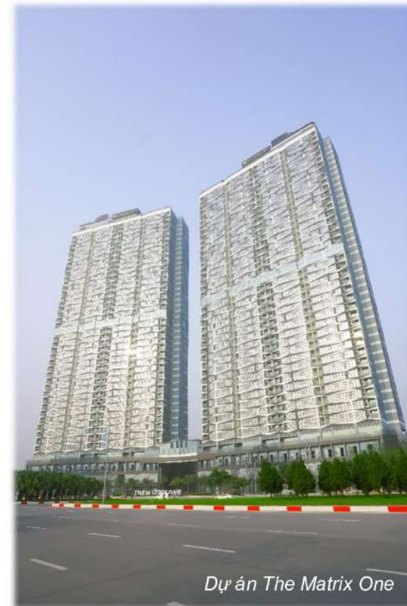
Dự án The Matrix One

- Trong năm 2022, Công ty đã hoàn thành việc Phát hành cổ phiếu để trả cổ tức qua đó nâng vốn điều lệ công ty lên thành 396.499.270.000 đồng.