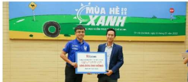
Tài trợ chương trình “Mùa Hè Xanh” trường Đại học Kiến trúc TP.HCM và Đại học Bách Khoa TP.HCM